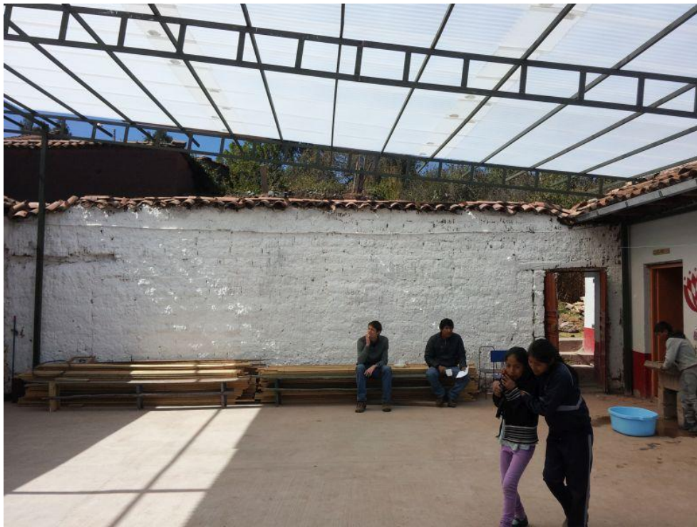
A Picol, les Chicos tienen ahora un patio cubierto para los recreos